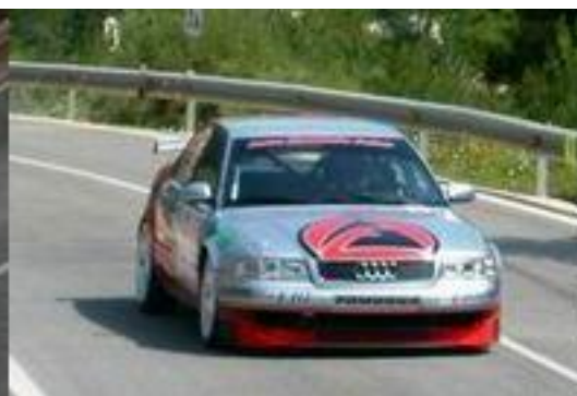
...y repitió el domingo en asfalto seco. Este año tiene que ser el suyo