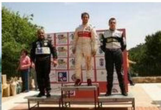
Podio "democrático" el sábado con un representante de cada marca...