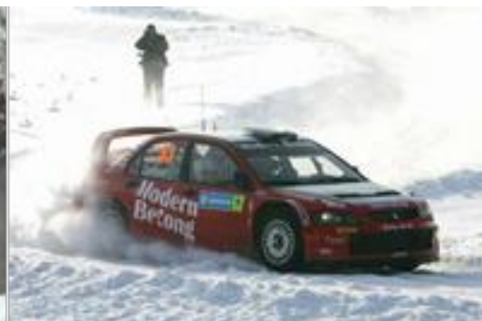
Sensacional rallye de Carlsson, tercero al final