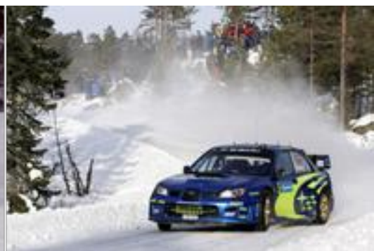
...mientras que a Solberg todo se le torció ya desde el primer día