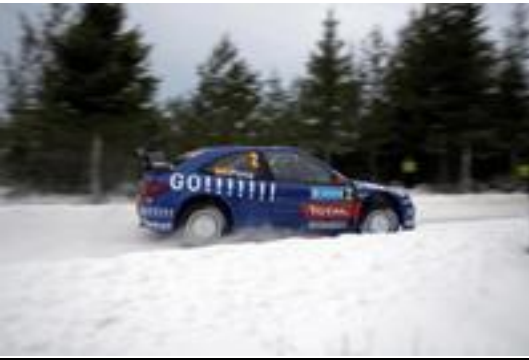
Pons nunca estuvo entre los diez más rápidos en los tramos pero no falló y acabó séptimo

También se quedaron en el trayecto gente como el noruego Kristian Solhberg, constantemente entre los diez mejores con un Subaru privado o el austriaco Stohl, de nuevo convincente con el 307WRC de Bozian ... hasta que lo puso patas arriba ¡exactamente en el mismo lugar en que se había salido momentos antes su compañero Henning Solberg! Al menos el noruego pudo seguir, dando de paso unas de esas imágenes que ponen en valor la abnegación de pilotos y copilotos, cuando su compañero Menkerud rompía a patadas lo que quedaba del parabrisas para facilitar la visión de su piloto aunque ello les costase a ambos ir "tragando nieve" hasta la meta.