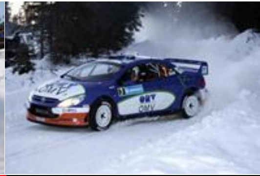
Stohl fue uno de los muchos que luchaban por las primeras plazas y acabaron fuera