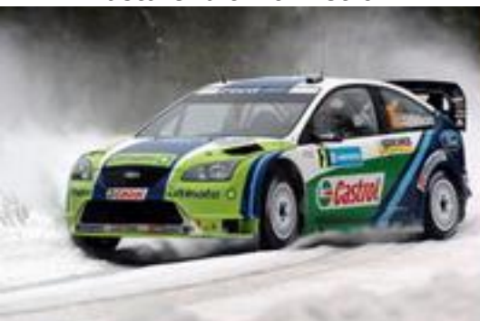
Gronholm volvió a ganar con el Focus

La nieve en grandes cantidades volvió a hacer acto de presencia en el Rallye de Suecia, alejando los problemas con los tramos de tierra poco nevados que se habían producido en años anteriores. Con un terreno prácticamente cubierto al 100% por el tan deseado manto blanco el espectáculo estaba asegurado y el único rallye totalmente invernal que queda en el calendario del campeonato del mundo se pudo desarrollar del mejor modo posible ofreciendo esas imágenes que cada año se graban en la retina de los aficionados, en las que la maestría al volante de los mejores pilotos de rallyes del mundo se puede apreciar en su máxima expresión. Con una inscripción en la abundaban los buenos especialistas escandinavos al volante de WRC privados, la prueba sueca no iba a defraudar las expectativas, dando lugar a un rallye tan bonito de ver como emocionante de seguir, y en el que no faltaron los duelos cerrados, estando la victoria en el aire casi hasta el final y siendo la lucha por el último escalón del podio apasionante hasta el último metro.