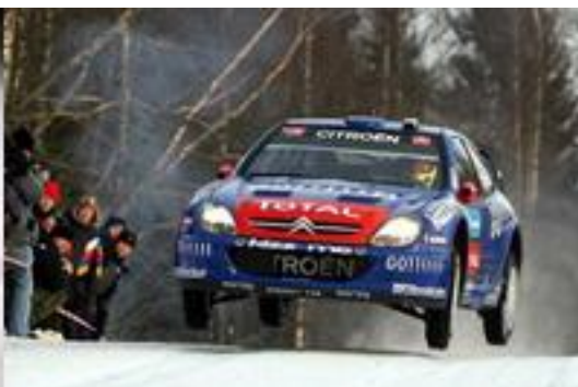
Loeb fue el único que siguió el ritmo del vencedor