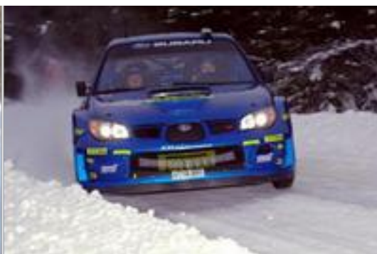
Los Subaru tuvieron otro día negro, Atkinson aunque retrasado pudo terminar...